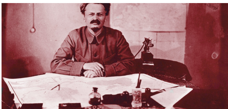
Leon Trocký – Lev Bronstein