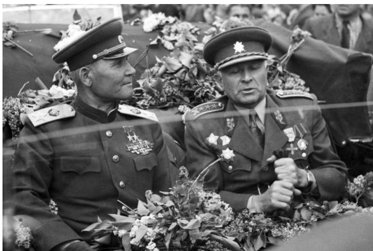
Maršál Ivan Koněv (vlevo) v Praze.

Po skončení 2. světové války zahájil Josif Stalin v Sovětském svazu a také ve všech státech pod vlivem SSSR proces naprosté eliminace procesů řízení světových sionistů, kterým se ještě počátkem 50. let říkalo Trockisté podle bolševického předáka z dob VŘSR v roce 1917. Původním cílem Bolševické revoluce bylo zavraždění carské rodiny a odcizení veškerého majetku a zdrojů Ruska zahraničními sionistickými bankami naproti dluhu, který si měl SSSR vytvořit u londýnských bank. Celé Rusko se mělo dostat do soukromých rukou Domu Rothschild, který sponzoroval a financoval celou revoluci v Rusku a zařídil cestu Vladimira Uljanova do Ruska v roce 1917, aby celý proces řídil.