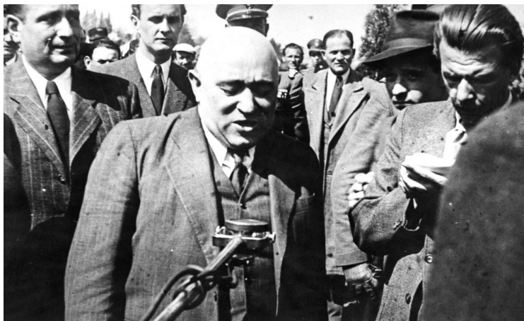
Mátyás Rákosi, původním jménem Mátyás Rosenfeld, generální tajemník strany a premiér vlády od roku 1948.

Maršál Koněv zachránil Maďarsko před majdanizací země. Vzpomeňte si, jak v roce 2014 stejní fašisté z řad mládeže a Pravého sektoru upálili zaživa v Oděse v Domě odborů desítky lidí, o kterých si mysleli, že mají ruský původ. Mezinárodní žid, tedy sionista, si nikdy nezašpiní ruce krví osobně. Na všechno má své lidi, nezkušené děti, nezkušené a pokud možno duševně nemocné děti, různé Gretty, nezkušené mladíky, nezkušené elévy v rolích ministrů zahraničí atd.