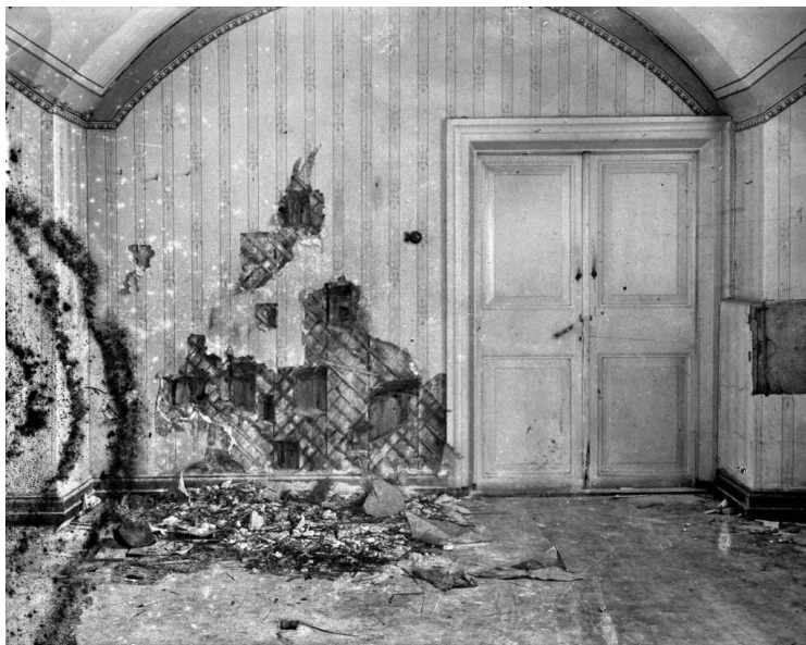
Popravčí místnost v Jekatěrinburgu, kde byla postřílena celá carská rodina.

Informace o tom, jakým způsobem byla popravena rodina Romanovců, se neutajila. Není známo, kdo informaci vynesl, ale dostala se ven a dozvěděli se o ní všechny šlechtické rody v Evropě. Britská rodina z rodu Saxe-Coburg und Gotha má na rukách krev Romanovců! Zpráva se šířila rychlostí blesku mezi šlechtou. Britská královská rodina se na tento osud Romanovců připravila dopředu a rozhodla se k neuvěřitelnému a nevídanému kroku, k zahazení svého rodového erbu a jména a přejmenovali svůj rod na Windsor podle starého zchátralého hradu ve Walesu.