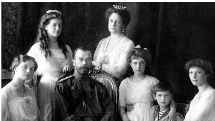
Mikuláš II. s rodinou – Romanovci.

Prostě rozvětvená rodinka. Dne 17. července 1918 byla ale celá carská rodina Romanovců postřílena bolševickými gardisty v malém domku v Jekatěrinburgu. Příkaz k popravě přišel z Londýna.