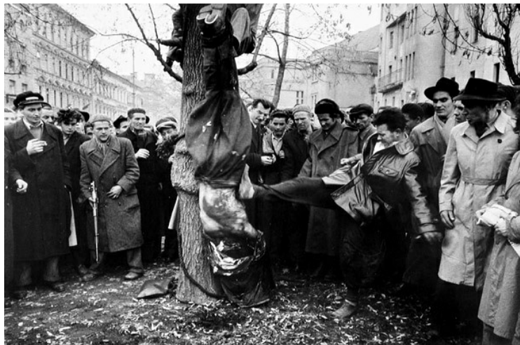
Povstalci pověsili člena vládnoucí strany hlavou dolů.

Tento manifest opravdu nepochází od neziskové organizace Milion chviliek, nepochází ani od Greta Thunberg, přestože v posledním bodě manifestu se hovoří o parlamentu mládeže, kde mladí a mnohdy nezletilí lidé chtějí řídit Maďarsko. Odstraňování pomníků uvedené v manifestu, přezkumy koncesí a povolení Rusům, jestli smí těžit uran. Snaha prodávat uran na světových trzích za tvrdou měnu. Tak mladí studenti a už tak chytří, že je zajímá těžba uranu a prodeje na světových trzích za tvrdé měny? Požadavek mladých, aby premiérem byl bývalý a jediný neetnický židovský člen Rákosiho vlády Imre Nagy. To nevymyslíš! Maďarští studenti s tímto požadavkem vyšli do ulic a když se ukázalo, že jejich požadavky strana nesplní, začalo násilí a povstání. Imre Nagy uchopil s pomocí ozbrojené ulice moc a je znovu premiérem. Ve funkci bude od 24. října do 4. listopadu 1956.