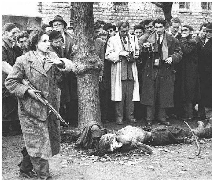
Povstalci znetvořili tělo údajného špiona, který donášel informace vládnoucí dělnické straně.

A víte proč je v těch dokumentech a manifestech taková shoda? Protože převrat v Maďarsku v roce 1956 i převraty dnes a nedávno na Majdanu řídí stejní lidé, světoví sionisté. Globalizace je nástrojem sionismu a předchozího trockismu. Je to cesta, jak světový žid chce přijít k majetkům za "tvrdé" peníze, které si ale sám tiskne ve FEDu, a za dluhový úpis k majetku států. V roce 1956 to byl uran, to nejdůležitější pro světové sionisty v éře atomového věku, který v 50. letech začínal.